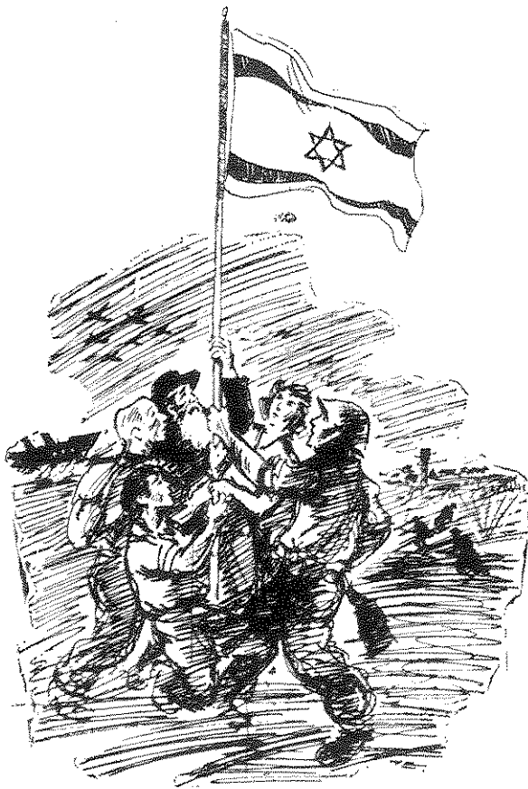
שמחת הנפת הדגל, הארץ, ערב יום העצמאות תש"ט-1949. איור של יוסף בס

ב-1951 הובעה "שמחה על הישגים" וצוינה בגאווה "המשכת המפעל הנועז ביותר" של העליה ההמונית מארצות הדיכוי. 11 על יום העצמאות נכתב שהוא "קודש לשמחה. מפגנים והגיגות, תהלוכות ותחרויות של הצבא, בתי הספר, של אגודות נוער וספורט - כולם יעמדו בסימן שמחה..."