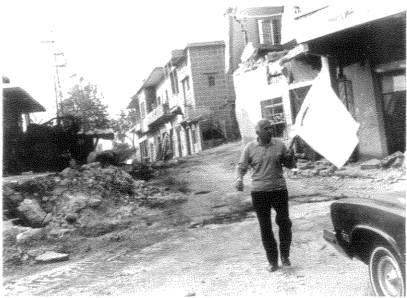
מלחמת לבנון במחצית הראשונה של שנות ה-80 גרמה לשינוי בהארץ

ב-1987, לפני שפרצה האינתיפאדה הפלסטינית הראשונה, המשיך העתון בניחול מאבק הציונות החילונית ביהדות הדתית: "אבות התנועה הציונית יצאו לדרכם חדורי הכרה, כי אין להמתין לביאת המשיח, אלא שבכוחם של בני תמותה לתחיות את הממלכתיות היהודית