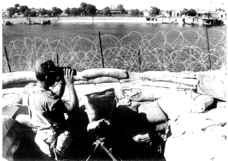
על שפת תעלת סואץ לאחר מלחמת ששת הימים

במאמר המערכת הראשון שלאחר עליית הימין לשלטון הסתמן שינוי בולט בקו המסורתי של מאמרי המערכת. השינוי נולד גם מיחסי השלום בין ישראל למצרים שהחלו להירקם מאז שהימין החל לשלוט. עיקר השינוי השתקף במתן עדיפות עליונה לשלום, והוא בא לידי ביטוי